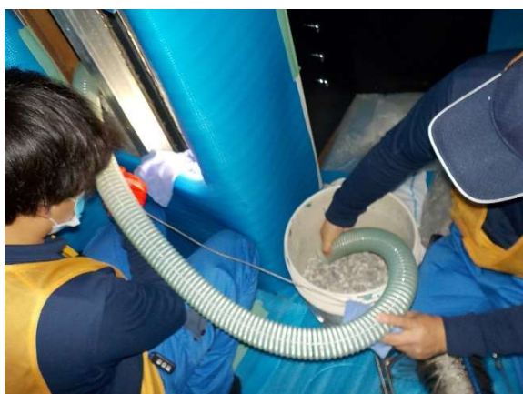
排水管内部研磨作業