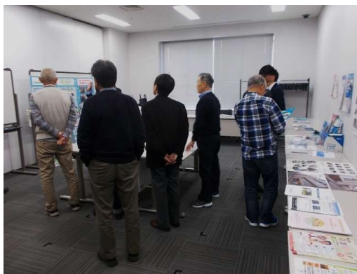
展示コーナーの展示、サンプル、パンフレットの展示 また会員、賛助会員の説明や相談