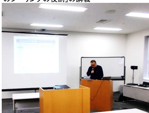
会員星野講師による「単身高齢者住居の相談事例」の講義