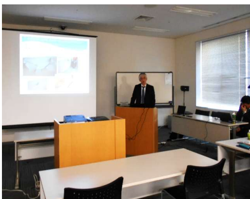
賛助会員植本講師による「塗装工事におけるトラブル事例とその対策」の講義