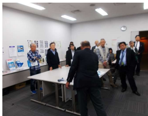
展示コーナーの会員による給排水管更生工 法の実物サンプルの実演