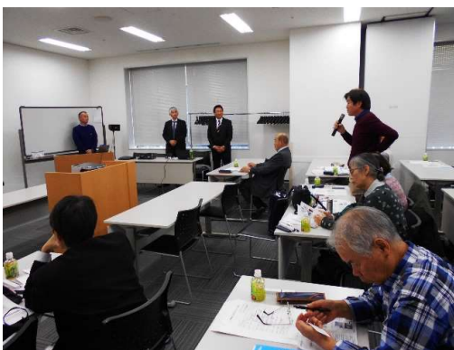
司会丸島理事と講師全員による質疑応答